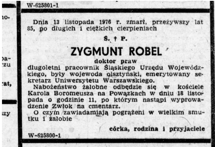
Nekrolog Zygmunta Tadeusza Robla („Życie Warszawy” 1976, nr 274, 17 XI, s. 11)