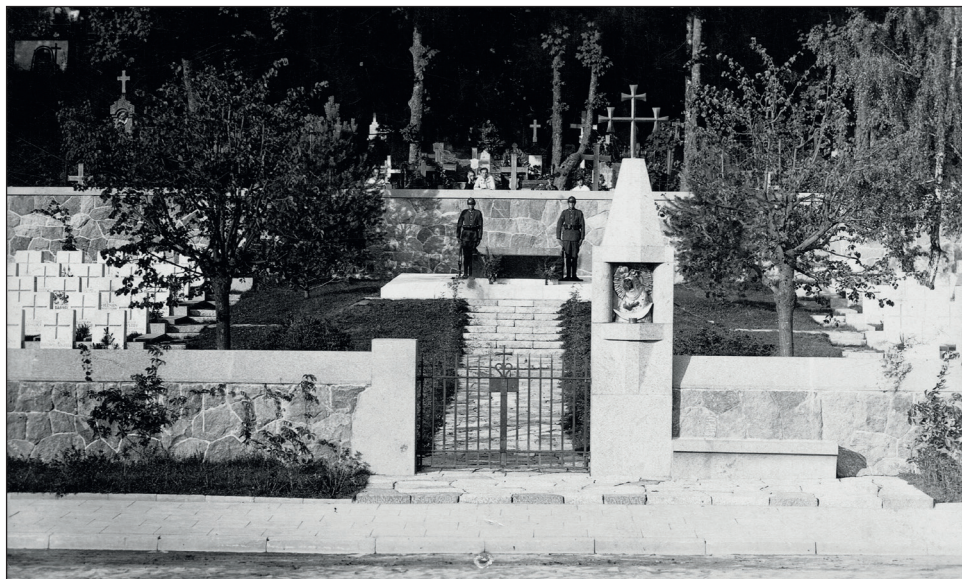
Mauzoleum na wileńskiej Rossie w latach 1936–1939