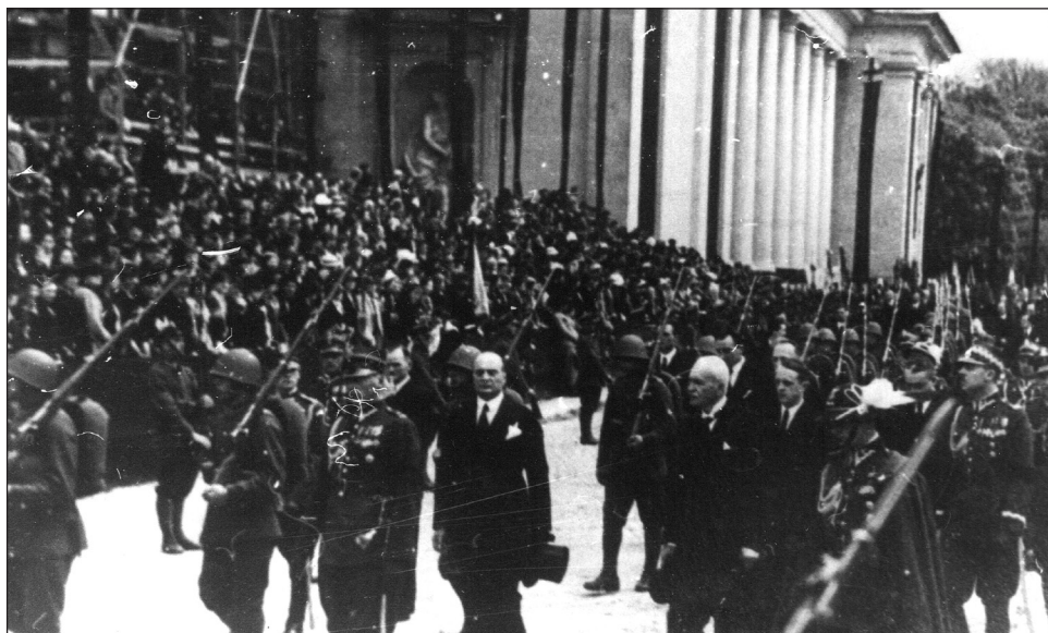
Pochód uczestników uroczystości pogrzebowych przez historyczne centrum Wilna, widoczny m.in. prezydent Ignacy Mościcki