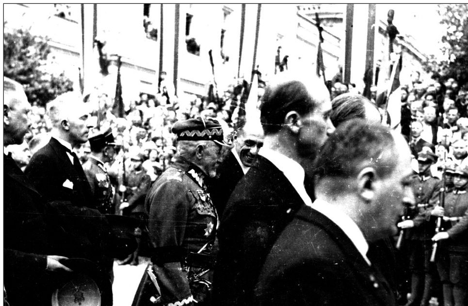
Uczestnicy uroczystości pogrzebowych, m.in. gen. Lucjan Żeligowski