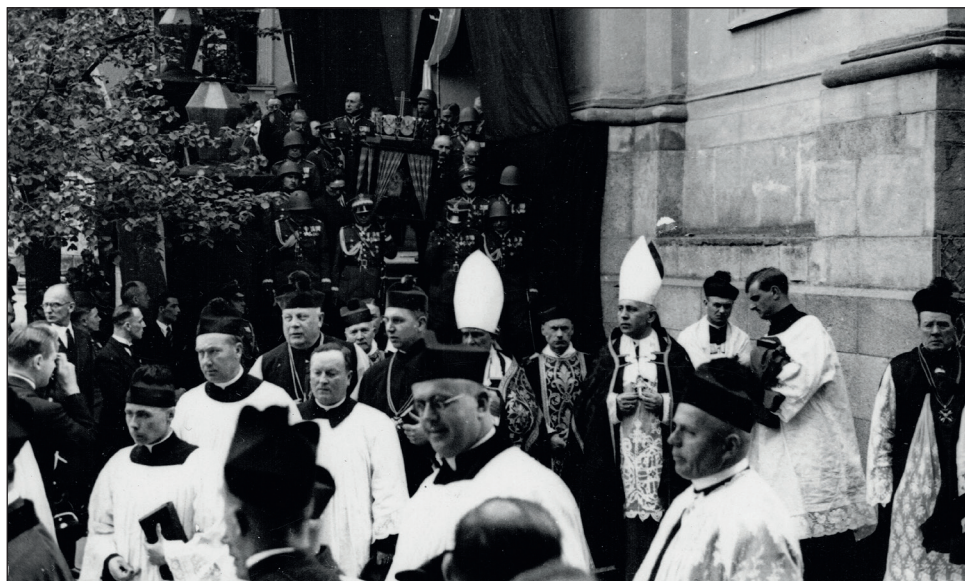
Wyprowadzenie lektyki z sercem J. Piłsudskiego z kościoła św. Teresy w Wilnie