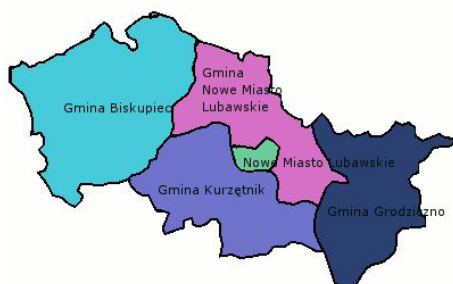
Rys. 2 Gminy powiatu nowomiejskiego.