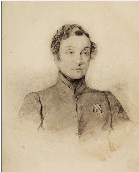
Fot. Portret N. Durowej (1837).