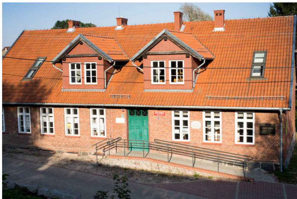
Izba Pamięci Marii Zientary-Malewskiej w Brąswaldzie