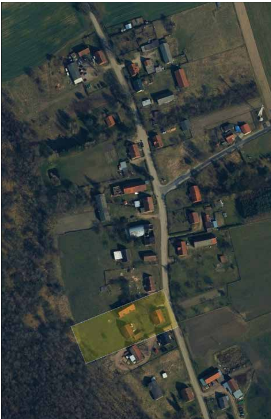
3. Obszar dawnej leśniczówki w Mortągu, stan z roku 2021, Geoportal 2