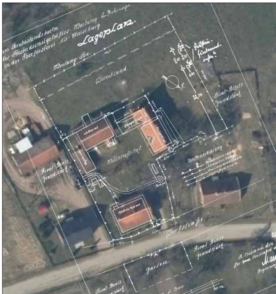
1b. Plan leśniczówki w Mortągu z 1929 r. przedstawiony na podkładzie ortofotomapy z roku 2021 (opr. Leszek Sufranek)

należał zapewne do leśniczówki, gdyż działki obok opisano jako własność prywatną ( Privat-Besitz ). Prawdopodobnie jest to wymieniony przez Boettichera ogród, na obszarze którego odkryto relikty piwnic z ozdobioną barwnymi kaflami posadzką i dalszymi ruinami w jego przedłużeniu. Poparciem takiego domniemania jest obecność osuszonego jeziora na południe od tego ogrodu, o czym informuje także Boetticher. Obecnie jest to obszar częściowo użytkowany.