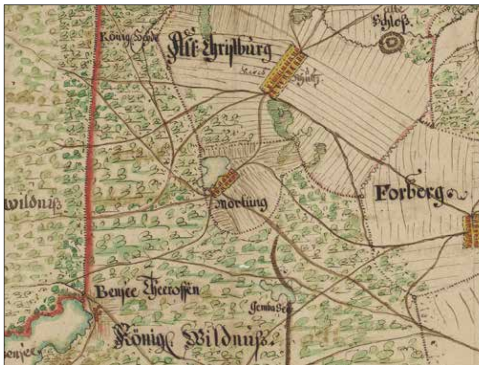
2. Mortąg i okolice wg planu S. v. Suchodolca z 1705 r. GStA PK, XX HA, D 10031

Budynek leśniczówki i zabudowania gospodarcze zachowały się do naszych czasów. Obecnie są własnością prywatną (fot. 3). W ich sąsiedztwie kilka lat temu (2009 r.), podczas prac remontowych w pobliskim budynku znaleziono cegły gotyckie (fot. 4), które pochodzić mogły z wcześniejszej rozbiórki zachowanych relikwów dworu i jego przyległości 56 . Mając na uwadze odkryte w 1934 r. fundamenty oraz informacje Adolfa Boettichera o relikwach piwnic w ogrodzie leśniczówki, domniemywać możemy, że mamy w obu przypadkach do czynienia z większym kompleksem zabudowań gotyckich, znajdujących się na kilkudziesięciometrowym obszarze wokół dawnej leśniczówki w Mortągu, a które stanowią elementy znanego ze źródeł XIV i XV w. dworu oraz folwarku krzyżackiego. Aby potwierdzić lub wykluczyć niniejszą tezę autorów w szczególności pomocne okazać się mogą badania archeologiczne.