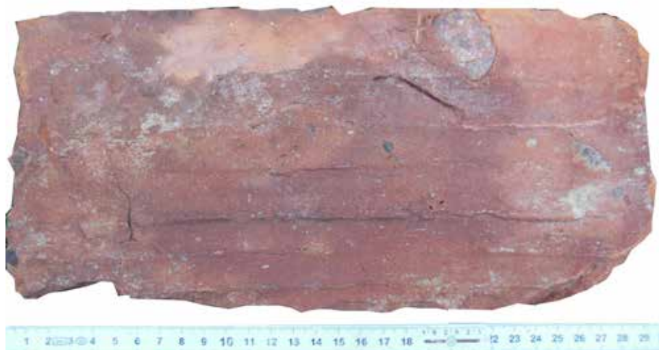
4. Cegła gotycka znaleziona wspólnie w Mortągu w okolicy dawnej leśniczówki